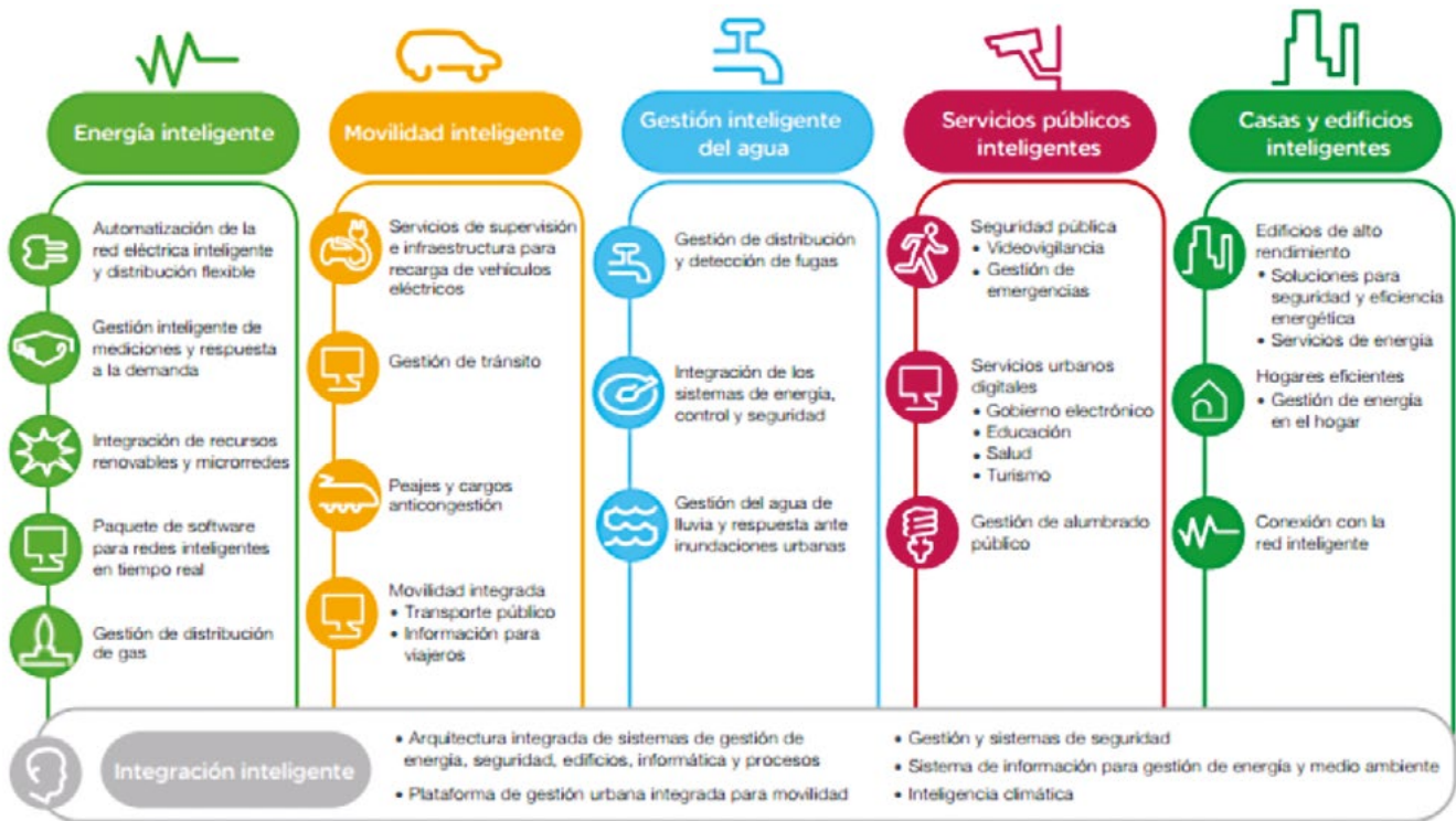
Figura 2. Soluciones tecnológicas planteadas por Schneider Electric

públicos y construcción. En la siguiente figura se sintetizan las propuestas.