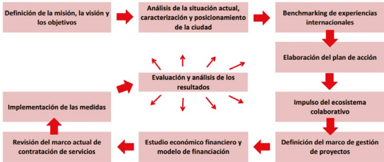
Figura 1. Hoja de ruta de la Smart City expuesta por CTecno, 2012

se sintetiza la propuesta de los autores.