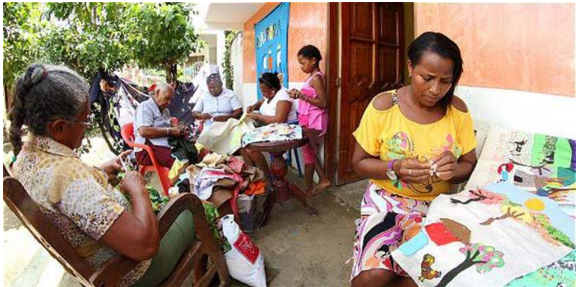
Figura I. Las mujeres tejiendo sueños de los Montes de María.