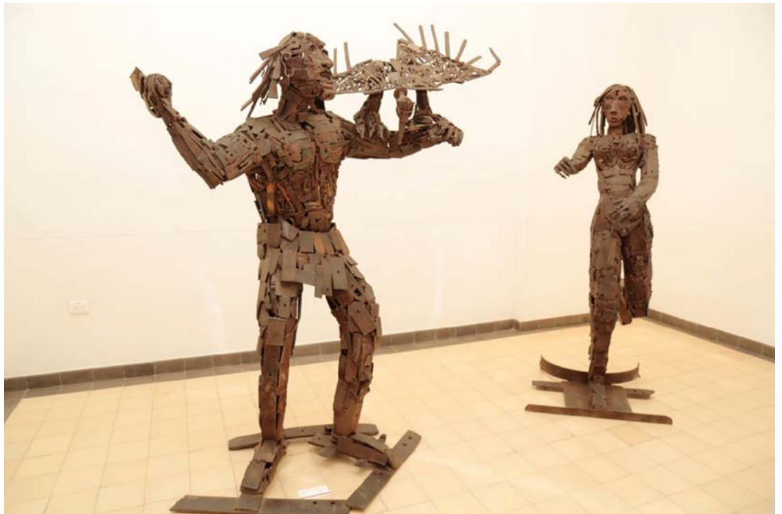
Figura III. Con armas fundidas se recrea la exposición cultural 'Construyendo Caminos de Paz: entre fuego y fuego'