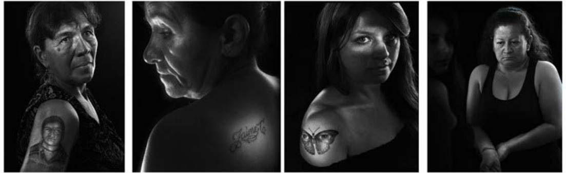
Figura II. Víctimas de falsos positivos en Soacha