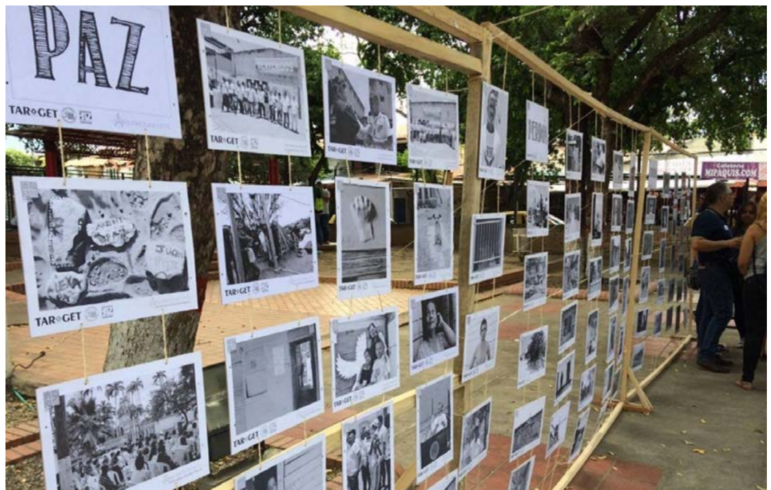
Figura IV: Exposición muestra artística UFPS Territorio de paz

En esta misma línea, el 26 de septiembre de 2016 se llevó a cabo un acto académico y de reconocimiento a las víctimas del conflicto armado en el marco de la firma de los acuerdos de paz con las FARC EP y simultáneamente se transmitió este evento de interés nacional.