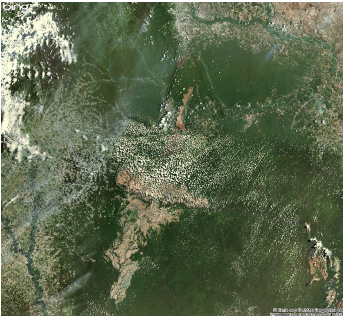
Imagen 01. El espacio claro en sección inferior de la imagen corresponde a los llanos del Yari. Arriba se observa la zona sur de la Sierra de La Macarena, al nororiente los resultados del avance de la colonización que -sobre el río Ariari- pareciera acercar las sabanas orinocences a La Macarena (sabanas que se aprecian en la sección superior derecha de la imagen). Al oriente se puede observar el estado actual del avance de otro frente de colonización amazónica: la colonización en las cercanías del río Caguán. Al occidente la selva amazónica y una sección de la Serranía de Chibiriquete.