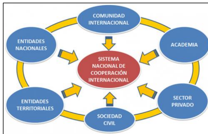
Gráfico 3. Esquema Sistema Nacional de Cooperación Internacional