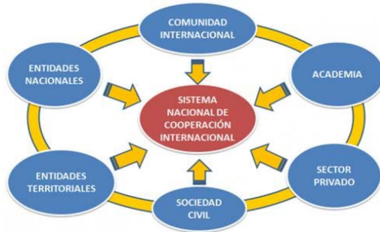
Figura 3. Sistema Nacional de Cooperación Colombiano

Las brechas de desigualdad (la mayor del continente), pobreza y salud, son los principales retos a los que debe enfocarse el sistema de cooperación, para lo cual necesitará la colaboración de todos los actores del sistema. Es allí donde las alianzas para el desarrollo cobran relevancia. El octavo objetivo del desarrollo hace referencias a este particular.