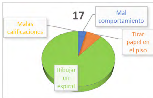
Figura 3. Pregunta 5. ¿Cuál fue la acción cometida por el niño, en la cual es amonestado por el adulto?

Para concluir, se analizaron los resultados obtenidos en la implementación de la secuencia didáctica propuesta, estos mostraron un avance significativo en lo concerniente al fortalecimiento de la lectura crítica en los estudiantes de undécimo grado mediante el análisis de los memes como recurso pedagógico. Lo descrito quedó evidenciado en la interpretación de los resultados obtenidos mediante un análisis cuantitativo y otro cualitativo, los cuales presentamos a continuación: