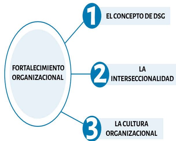
Figura 2. Categorías para el fortalecimiento organizacional

A partir de estas preguntas, y del marco teórico elaborado, las categorías de la investigación han sido organizadas en dos grandes bloques: las que hacen referencia a la DSG respecto al fortalecimiento organizacional (figura 2) con sus respectivas cuestiones (tabla 2) y las que hacen referencia a los proyectos de Cooperación y EpTS (figura 3) con sus respectivas cuestiones (tabla 3).