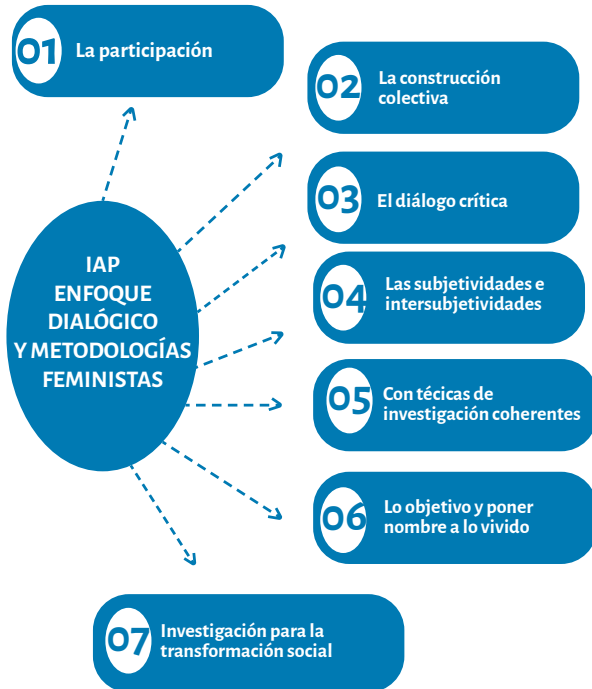
Figura 4. Las características del paradigma de investigación