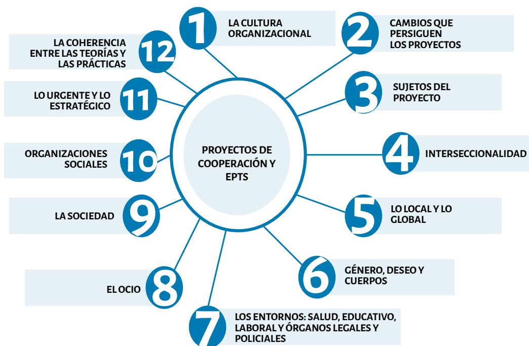
Figura 3. Categorías que hacen referencia a los proyectos de Cooperación y EpTS