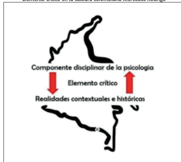
Figura 1 Elemento crítico en la cátedra colombiana Mercedes Rodrigo