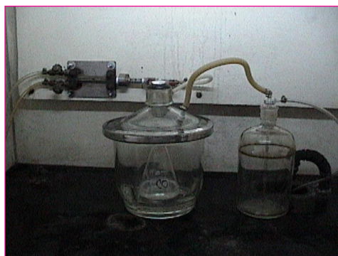
Montaje para el crecimiento de las bacterias carboxidótrofas nativas

Una vez se observó el crecimiento bacteriano por ligera turbidez del medio y se verificó por recuento celular en la cámara de Neubauer, se hicieron siembras en medio sólidas para caracterizar las colonias. Este medio sólido era el mismo medio líquido al cual se le agregaba agar (15g/L). La pureza de los cultivos se aseguró mediante réplicas sucesivas y verificación por microscopía después de coloración de Gram.