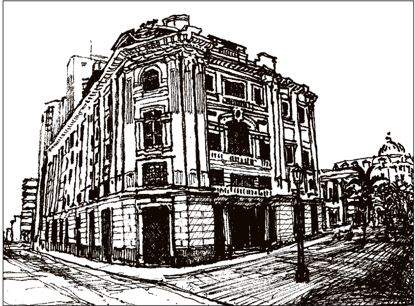
Teatro Jorge Isaacs (1931).

Más que ser validados de manera ingenua (con el riesgo de caer en un populismo romántico o en el folklorismo), los conocimientos del sentido común deben ser objeto de estudio, reconociéndolos en su mestizaje y ambigüedad, como condición de base para su crítica, puesto que sobre ellos reposa no sólo la pervivencia y reproducción de los valores dominantes, sino su posibilidad de crítica y transformación (Williams, 1977; Martín Barbero, 1987). Es decir, reconocer que en lo hegemónico obran también fuerzas opuestas a la dominación, por ejemplo, la promoción de la diversión, la alegría, el gusto por el presente, el placer y lo banal, los cuales obran contra las éticas productivas y disciplinarias del trabajo, el esfuerzo, la seriedad y la institucionalidad (reducidos a sacrificio y obligatoriedad). Contra lo sacrificial, lo popular resiste y perdura como una pulsión primordial de sobrevivencia y de afirmación vital de la existencia, en tanto en