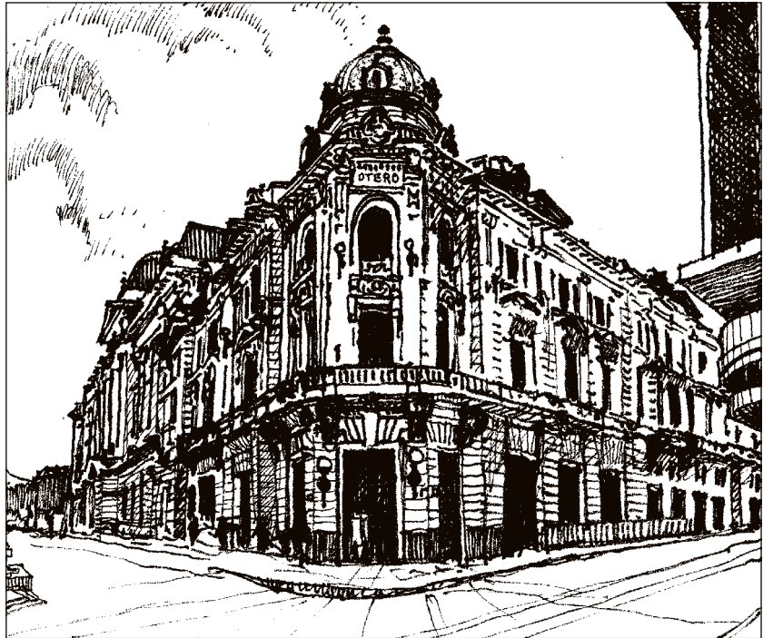
Edificio Otero (1926).

La vivencia de pertenencia a un grupo familiar, que produce un sentimiento de bienestar en los hijos, está apoyada predominantemente en el culto a la figura materna, lo que contribuye a su alta idealización. Esa glorificación de la figura materna, bastante extendida socialmente en nuestro medio, no solo se apoya en los discursos psicológicos o científicos sobre salud familiar en la circunscripción de la identidad femenina al modelo mujer-mamá, sino que también proviene de matrices culturales de lo popular visibles en las narrativas del sentido común, que contribuyen de manera indirecta a imponer una idea de lo femenino vinculado a las funciones de madre, suplente y abastecedora de los deseos de los otros.