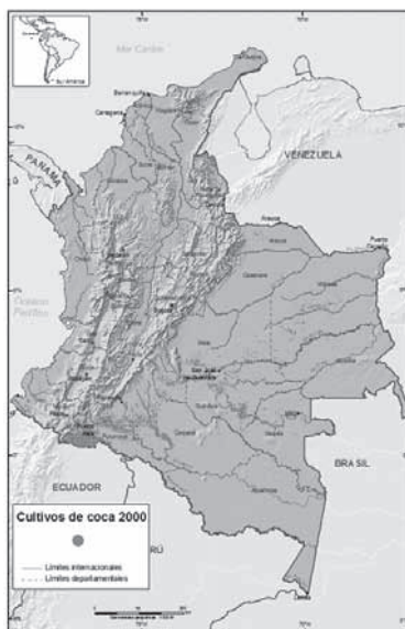
Gráfica 3: cultivos de coca en el 2000 (UNODC, 2006)

El fenómeno que se evidencia con dichos datos es al llamado efecto globo que es un desplazamiento de los cultivos de una zona a otra, gracias a la presión sobre una zona (erradicación constante) y generando una disminución de sus cultivos de uso ilícito, y un aumento de hectáreas cultivadas en una zona cercana.